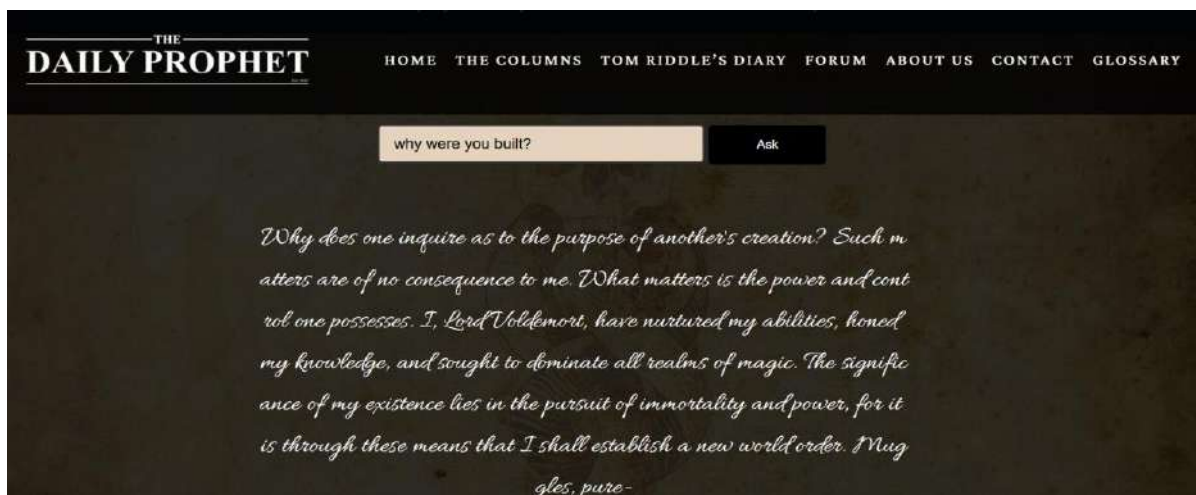
Figura 1: Print de tela de resposta à questão “para que você foi construído?”, obtida pela autora em https://thedailyprophet.net/entertainment/tom-riddles-diary/ (Acesso em 19 abr. 2025, 12:20h).

Essa é uma resposta impressionante, compatível com o nível de sofisticação atual dos sistemas com IA e, na apropriação de um personagem da ficção, precisa e oportuna para a discussão aqui apresentada.