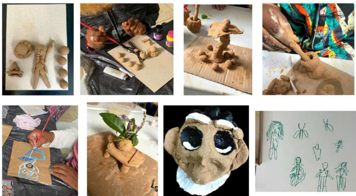
Figura 1. Imagens representativas das oficinas realizadas em diferentes encontros com argila, tintas e canetinhas.

No desfecho dos atendimentos, no segundo semestre de 2025, houve pedidos para que a finalização do acolhimento fosse novamente realizada com argila e tinta, sinalizando a importância desse recurso na simbolização do inconsciente e no resgate de uma experiência mais viva de si em meio ao campo institucional adoecido.